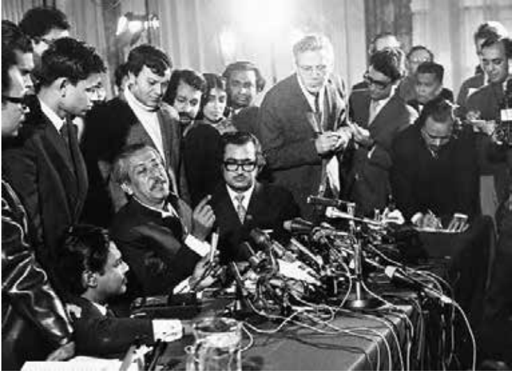
১৯৭২ সালের ৮ই জানুয়ারি পাকিস্তানের কারাগার থেকে মুক্ত হয়ে লন্ডনে ক্ল্যারিজেস হোটেলের প্রেস কনফারেন্সে বিশ্ব মিডিয়ার মুখোমুখি বঙ্গবন্ধু শেখ মুজিবুর রহমান