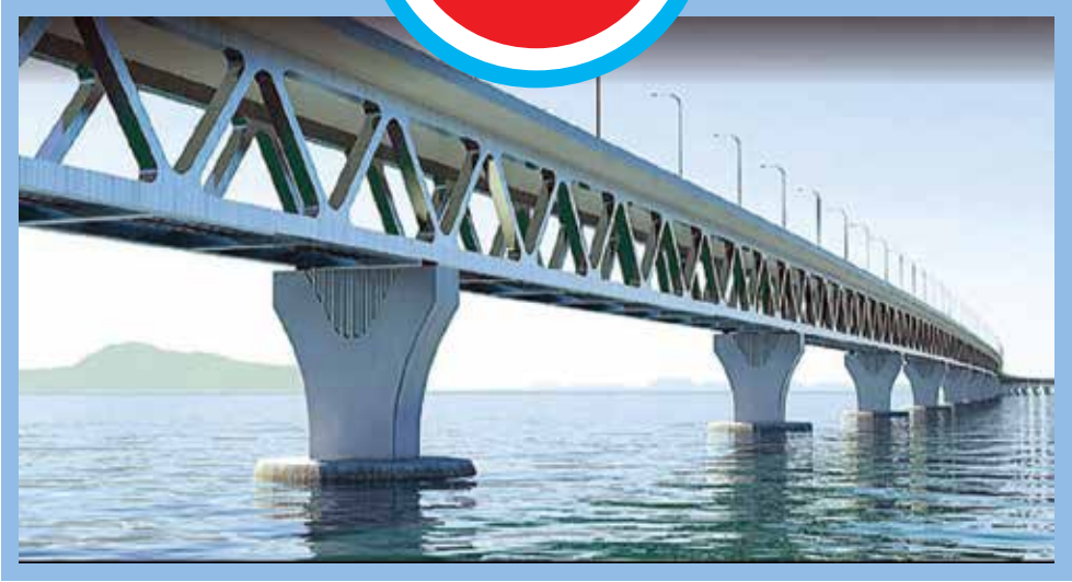
পদ্মা বহুমুখী সেতু

গণপ্রজাতন্ত্রী বাংলাদেশ সরকারের মাননীয় প্রধানমন্ত্রী বঙ্গবন্ধু কন্যা শেখ হাসিনা ২৫ জুন ২০২২ তারিখে গৌরব ও সক্ষমতার প্রতীক দেশের বৃহত্তম সেতু পদ্মা সেতুর শুভ উদ্বোধন করেন। কোনোরূপ বৈদেশিক সাহায্য ছাড়াই মাননীয় প্রধানমন্ত্রী শেখ হাসিনার ব্যক্তিগত তত্ত্বাবধানে বাংলাদেশের নিজস্ব অর্থায়নে বাস্তবায়িত সর্ববৃহৎ প্রকল্প এই স্বপ্নের পদ্মা সেতু। মূল সেতুর দৈর্ঘ্য ৬.১৫ কি.মি। মুন্সিগঞ্জ জেলার মাওয়া থেকে শরীয়তপুর জেলার জাজিরা পর্যন্ত সংযুক্ত এই সেতুটি দুই স্তর বিশিষ্ট। এর উপরের স্তরে রয়েছে চার লেনের সড়ক পথ এবং নিচের স্তরে একটি রেলপথ। ৩০ হাজার কোটি টাকারও অধিক ব্যয়ে তৈরি এই সেতুটি বাংলাদেশের দক্ষিণাঞ্চলের সামাজিক, অর্থনৈতিক ও শিল্প বিকাশে উল্লেখযোগ্য অবদান রাখার পাশাপাশি এর উপকারভোগী হবে সারাদেশের মানুষ।