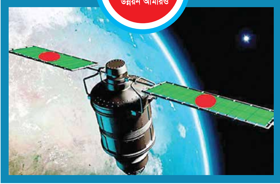
বঙ্গবন্ধু স্যাটেলাইট-১ : বাংলাদেশের মালিকানাধীন প্রথম কৃত্রিম উপগ্রহ

বঙ্গবন্ধু স্যাটেলাইট-১ বাংলাদেশের প্রথম ভূস্থির (Geostationary) যোগাযোগ ও সম্প্রচার উপগ্রহ। এর মধ্যে দিয়ে ৫৭ তম দেশ হিসেবে নিজস্ব স্যাটেলাইট উৎক্ষেপণকারী দেশের তালিকায় যুক্ত হয় বাংলাদেশ। এটি ১১ই মে ২০১৮ যুক্তরাষ্ট্রের কেনেডি স্পেস সেন্টার থেকে উৎক্ষেপণ করা হয়। এটি ছিল ফ্যালকন ৯ ব্লক-৫ রকেটের প্রথম পেলোড উৎক্ষেপণ। এটি ফ্রান্সের থেলিস অ্যালেনিয়া স্পেস কর্তৃক নকশা ও তৈরি করা হয়েছে। বঙ্গবন্ধু স্যাটেলাইট-১, ১৬০০ মেগাহার্টজ ক্ষমতাসম্পন্ন মোট ৪০টি কে-ইউ এবং সি-ব্যান্ড ট্রান্সপন্ডার বহন করছে এবং এর আয়ু ১৫ বছর। এর নির্মাণ ব্যয় প্রায় তিন হাজার কোটি টাকা। বর্তমানে স্যাটেলাইটের ব্যান্ডউইথ ও ফ্রিকোয়েন্সি ব্যবহার করে ইন্টারনেট বঞ্চিত অঞ্চল যেমন- পার্বত্য ও হাওড় এলাকায় ইন্টারনেট সুবিধা প্রদান করা সম্ভব হচ্ছে, প্রত্যন্ত অঞ্চলে ইন্টারনেট ও ব্যাংকিং সেবা, টেলিমেডিসিন ও দূরশিক্ষণ ব্যবস্থা প্রসারেও এটি ব্যবহৃত হচ্ছে। টিভি চ্যানেলগুলো তাদের সম্প্রচার সঠিকভাবে পরিচালনার জন্য বিদেশি নির্ভরতা কমিয়ে এর উপর নির্ভর করছে। ফলে দেশের টাকা দেশেই থাকছে। বড় প্রাকৃতিক দুর্যোগের সময় মোবাইল নেটওয়ার্ক অচল হয়ে পড়লে এর মাধ্যমে দুর্গত এলাকায় যোগাযোগ চালু রাখা সম্ভব। শুধু তাই নয় শেখ হাসিনা সরকারের বর্তমান মেয়াদেই বঙ্গবন্ধু স্যাটেলাইট-২ মহাকাশে উৎক্ষেপণেরও উদ্যোগ নেওয়া হবে। বঙ্গবন্ধু ১৯৭৫ সালের ১৪ই জুন বেতবুনিয়ায় ভূ-উপগ্রহ কেন্দ্র স্থাপনের মাধ্যমে যে স্বপ্নের বীজ বপন করেছিলেন, সেই স্বপ্ন মহীরুহে পরিণত করেছেন প্রধানমন্ত্রী শেখ হাসিনা।