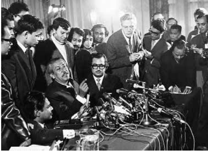
১৯৭২ সালের ৮ই জানুয়ারি পাকিস্তানের কারাগার থেকে মুক্ত হয়ে লন্ডনে ক্ল্যারিজেস হোটেলের প্রেস কনফারেন্সে বিশ্ব মিডিয়ার মুখোমুখি বঙ্গবন্ধু শেখ মুজিবুর রহমান