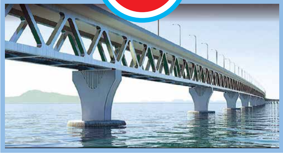
পদ্মা বহুমুখী সেতু

গণপ্রজাতন্ত্রী বাংলাদেশ সরকারের মাননীয় প্রধানমন্ত্রী বঙ্গবন্ধু কন্যা শেখ হাসিনা ২৫ জুন ২০২২ তারিখে গৌরব ও সক্ষমতার প্রতীক দেশের বৃহত্তম সেতু পদ্মা সেতুর শুভ উদ্বোধন করেন। কোনোরূপ বৈদেশিক সাহায্য ছাড়াই মাননীয় প্রধানমন্ত্রী শেখ হাসিনার ব্যক্তিগত তত্ত্বাবধানে বাংলাদেশের নিজস্ব অর্থায়নে বাস্তবায়িত সর্ববৃহৎ প্রকল্প এই স্বপ্নের পদ্মা সেতু। মূল সেতুর দৈর্ঘ্য ৬.১৫ কি.মি। মুন্সিগঞ্জ জেলার মাওয়া থেকে শরীয়তপুর জেলার জাজিরা পর্যন্ত সংযুক্ত এই সেতুটি দুই স্তর বিশিষ্ট। এর উপরের স্তরে রয়েছে চার লেনের সড়ক পথ এবং নিচের স্তরে একটি রেলপথ। ৩০ হাজার কোটি টাকারও অধিক ব্যয়ে তৈরি এই সেতুটি বাংলাদেশের দক্ষিণাঞ্চলের সামাজিক, অর্থনৈতিক ও শিল্প বিকাশে উল্লেখযোগ্য অবদান রাখার পাশাপাশি এর উপকারভোগী হবে সারাদেশের মানুষ।