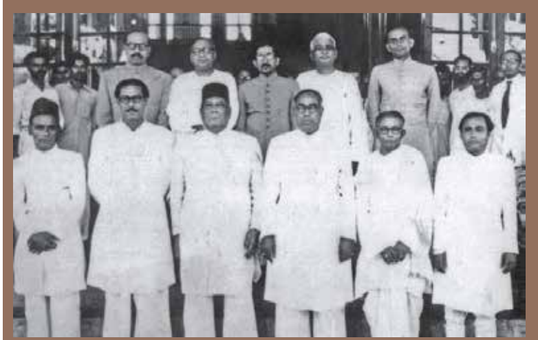
যুক্তফ্রন্ট সরকারের মন্ত্রীপরিষদ সদস্যদের সাথে ১৯৫৪ এর নির্বাচন পরবর্তী সময়ে বঙ্গবন্ধু শেখ মুজিবুর রহমান

পূর্ব বাংলার প্রাদেশিক পরিষদের নির্বাচনে মুসলিম লীগের শোচনীয় পরাজয় ঘটানোর লক্ষ্যে ১৯৫৩ সালের ১৪ই নভেম্বর আওয়ামী মুসলিম লীগ যুক্তফ্রন্ট গঠনের সিদ্ধান্ত গ্রহণ করে। যুক্তফ্রন্ট মূলত চারটি দল নিয়ে গঠিত হয়েছিল।