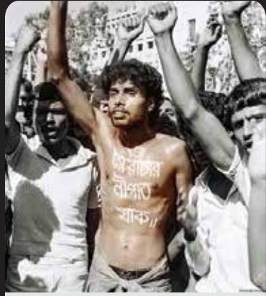
শহিদ নূর হোসেন